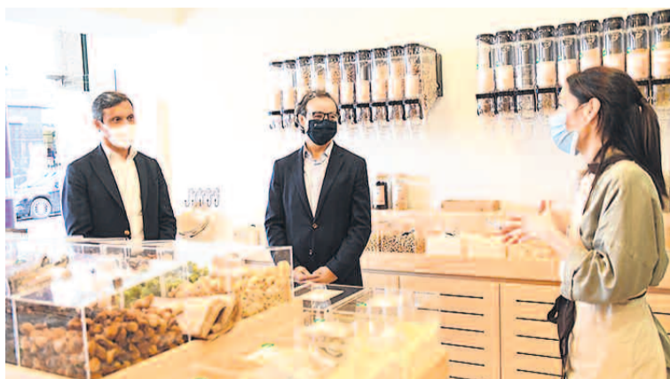
Momento da visita à loja